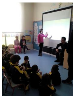
Presentación de nuestro trabajo al aula de Educación Infantil 4 años del colegio Episcopal.